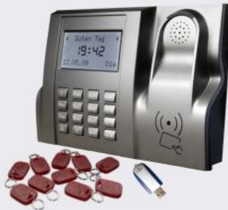
Smart Time Hardware

Smart time ist der kostengünstige Einstieg in die elektronische Zeiterfassung. Zum Preis einer einfachen Stempeluhr bietet es die Leistung und den Komfort eines elektronischen Systems.